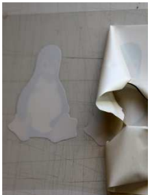
entgittern auf dem Tape

Bevor die Motive mit Hilfe eines Tapes übertragen werden können, sollte die Tinte trocken sein, sonst kann unter Umständen der Druck verwischen. Im Normalfall ist keine Wartezeit notwendig, es kann aber je nach verwendeter Tinte und Umgebungsbedingungen bis zu fünf Stunden dauern.