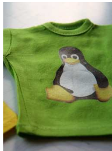
Trägerfolie abziehen, fertig!

Die geschnittenen und entgitterten Schriften oder Motive werden 10 Sek. bei 135 °C auf die Textilien aufgebügelt. Dann wird der Montagefilm nach kurzem Abkühlen warm abgezogen.