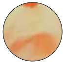
2004 golden yellow